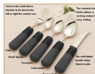
Besteck mit dickem Griff