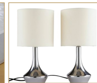
Nachttischlampen mit Berührungssensor