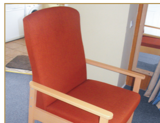
Sessel mit hohen Lehnen