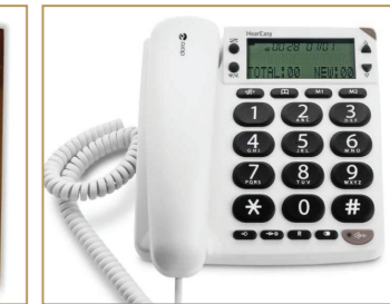
Telefon mit großem Display und Tasten, extra laut