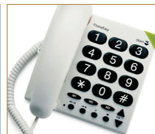
Telefon mit großem Display und Tasten, extra laut