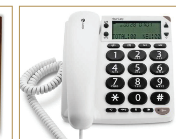
Téléphone adapté aux déficients auditifs