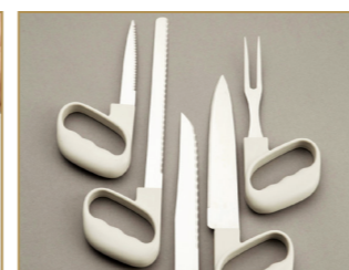
Couteaux de cuisine Reflex