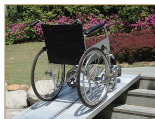
Rampe pour fauteuil roulant