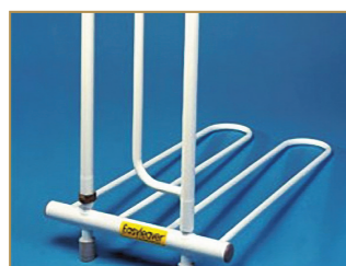
Barre d'appui pour le lit