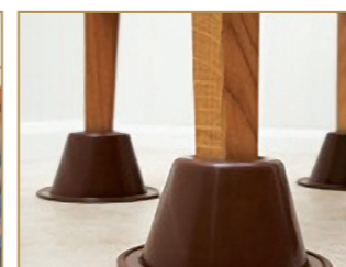
Rehausseur de chaise