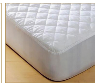
Protection de matelas pour lit simple et lit double