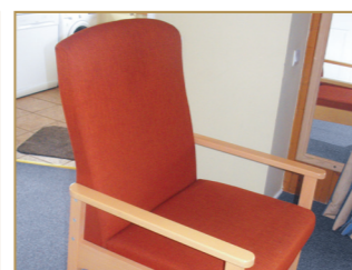
Fauteuil à large dossier