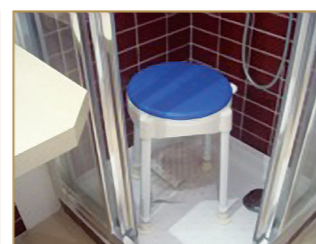
Tabouret de douche