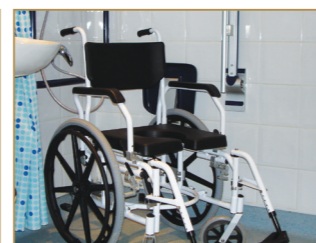
Chaise de douche