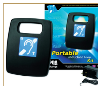
Amplificateur de son