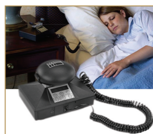
Oreiller vibrant (alarme pour malentendant)