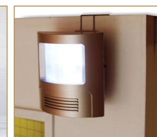
Sonnette de porte flashant