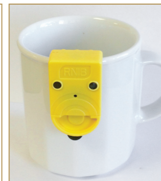
Appareil d'alerte de remplissage pour les tasses et mugs