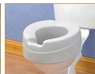
Rehausseur de siège pour les toilettes