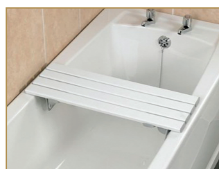
Planche de bain